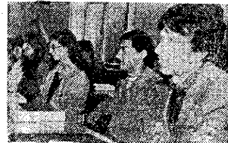
„Notăm numai problemele complementare...”